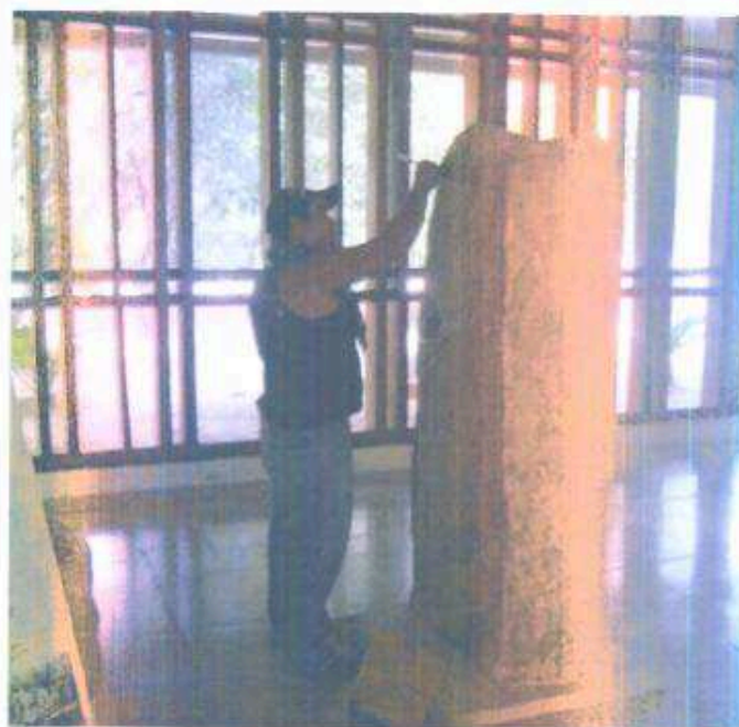
Figura 2. Operativo realizando limpieza en seco a una estela del Museo de Estelas y Altares

En la sección de Museos, Bodegas y Monumentos in situ, se continuó en los Museos Sylvannus Morley y Estelas y Altares, con la limpieza de vitrinas, monumentos exhibidos e infraestructura, observando que algunas vitrinas presentaron nidos de hormigas y en la maqueta del centro de visitantes se le hizo una limpieza y se resanó algunos agujeros utilizando cal fermentada (Figura 2).