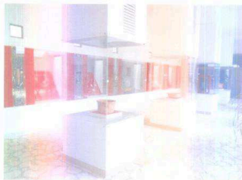
Figura 4. Vista suroeste de la Galería de Exhibición, mostrando los artefactos antes expuestos,

Se llevó a cabo el cambio de la exposición de los bienes culturales muebles, en la Galería de Exhibición, por lo que se cambiaron un total de 108 artefactos arqueológicos, que se encontraban en la Galería de Exhibición, dejando únicamente la réplica de la Placa de Leyden, ya que se acaba de ser expuesta en el mes de septiembre, por lo que se colocó una nueva exposición que cuenta con 100 artefactos, como son: piezas cerámicas, figurillas, artefactos de jade, concha, lítica mayor y menor (Figura 4).